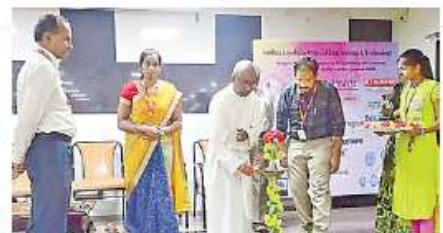
కార్యకాలను ప్రారంభిస్తున్న డైరెక్టర్ ఫాదర్ ప్రొఫెసర్

కరెన్సింగర్, న్యూఢి ఊడే: కంప్యూటర్ రంగంలో వస్తున్న ఆధు నిక సాంకేతికతను అవ ర్ణుకుంటేనే రాణించగల రని సాంకేతిక నిపుణులు సూజలు శ్రావ్య అన్నారు. ఆంధ్రా అయోల లాంజీని రింగ్ కళాశాల సీఎస్ఈ, బీ. రంగాల సంయుక్త ఆద్యక్షులలో కేంద్ర ప్రభుత్వ ఐసీఐ ఆకాడమీ